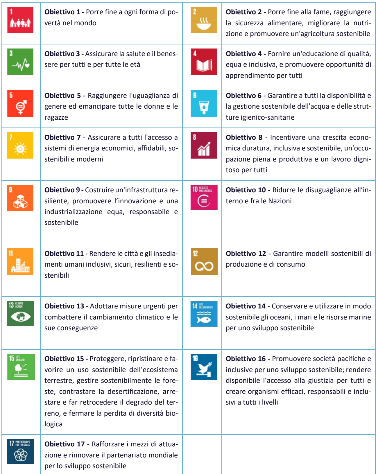
Tabella 11 - I 17 obiettivi ONU