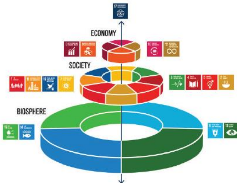
Figura 3 - La classificazione degli SDG dello Stockholm Resilience Center

ANCI, i Comuni e più in generale il sistema degli Enti Locali sono già coinvolti nella strategia di monitoraggio e raggiungimento degli Obiettivi ONU.