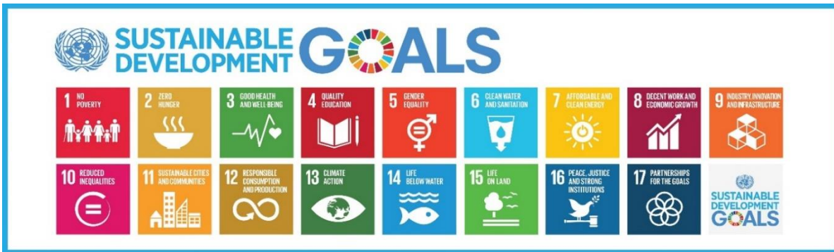
Figura 4 - I 17 obiettivi ONU in sintesi

La soddisfazione di ciascuno degli Obiettivi ONU può essere, con diversi gradi di rilevanza, influenzata dalle scelte d'intervento nei settori strategici previste per AnciLab (tabella 2). In sostanza le linee d'intervento di AnciLab, riferibili a una specifica area d'azione, possono essere sia valutate nella loro coerenza con gli Obiettivi ONU.